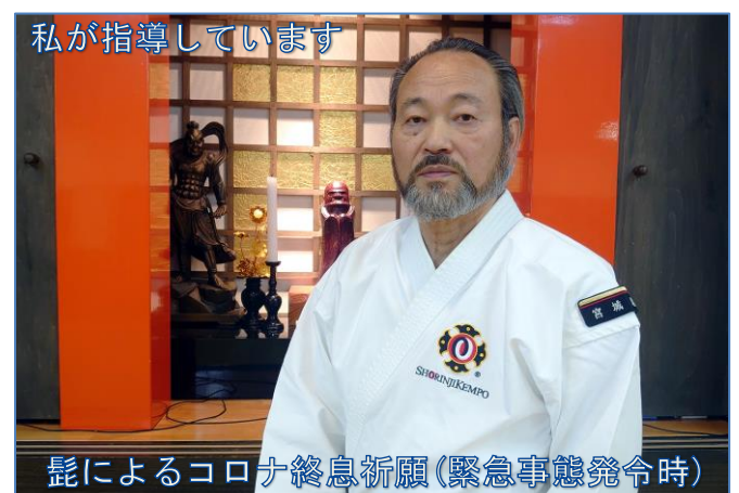
私が指導しています