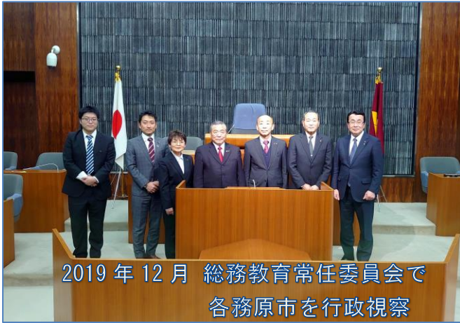
2019年12月 総務教育常任委員会で 各務原市を行政視察

かなかい事業だとは思いますが、貧しい家庭の子は学習塾には行けない。負の連鎖を断ち切るために、放課後児童クラブで学業も教える体制をつくり、充実を図ってはどうか。