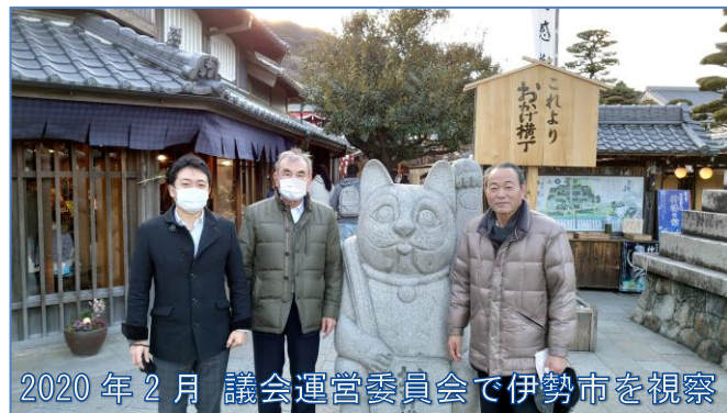
2020年2月 議会運営委員会で行伊勢市を視察

塩竈市としては、まず、2025年問題を乗り越えなければ、市の存続が危ぶまれます。何としても生き抜かなければなりません。そのためには、前定例議会でも述べましたが、 大きな問題として捉えているのが、「市民人口減少」と「市立病院の行方」です。市立病院への繰出しを無くし、数々の人口増加策を打ち出して、市民人口減少をくい止め、増加に転ずることが何より大事なことでないのでしょうか。 これを実現せずには、塩竈市の明るい未来は無いのではないのでしょうか。