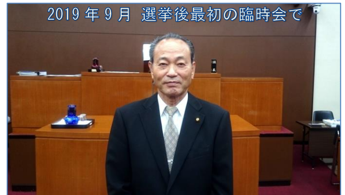
2019年9月 選挙後最初の臨時会で

病院の状況と本市の行財政状況等については、 第三者機関を設置して、総合的に分析を行い、その答申を参考に今後の方向性を議論して行くべきである。