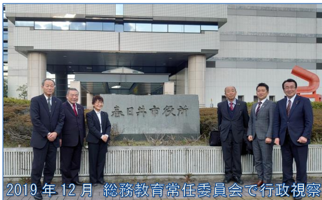
2019年12月 総務教育常任委員会で行行政視察

名称は「一般質問」ですが、内容は質問を基により良い塩竈を目指し、提案型の質問に徹しています。私の主張は以下のとおりです。