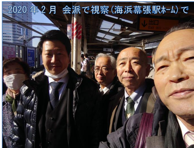
2020年2月 会派で視察(海浜幕張駅ホーム)で

今後も、市民の目線で皆様のご期待に沿うよう誠心誠意頑張りますので、更なるご支援よろしくお願ひ致します。