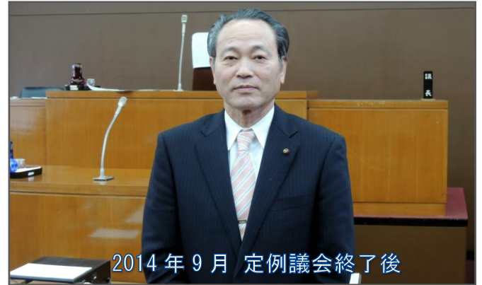
2014年9月 定例議会終了後

一致団結し行動してきました。それが会派所属議員の総括質疑や一般質問等で市当局への提言として表れていると思います。