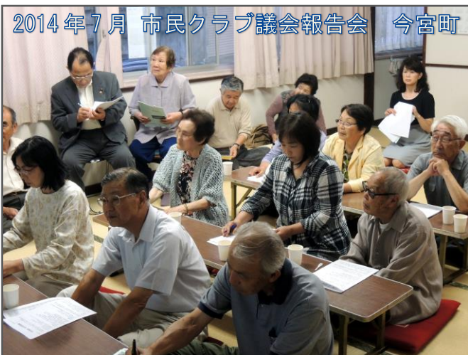
2014年7月 市民クラブ議会報告会 今宮町