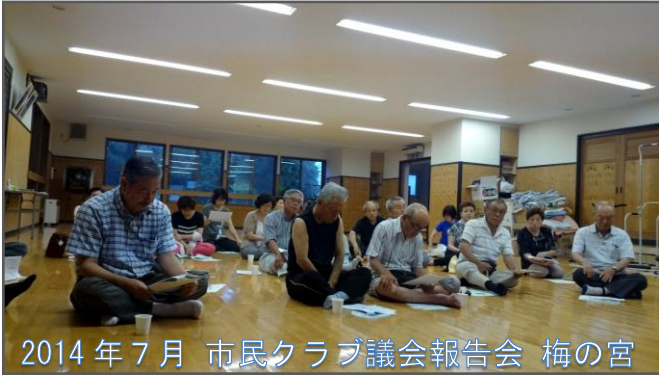
2014年7月 市民クラブ議会報告会 梅の宮