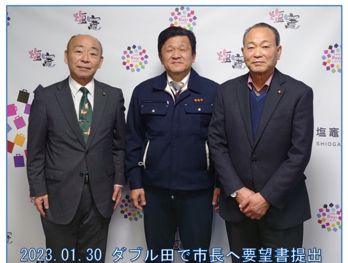
2023. 01. 30 ダブル田で市長へ要望書提出