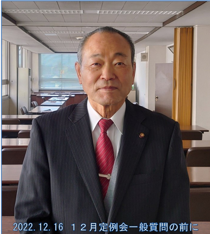
2022. 12. 16 12月定例会一般質問の前に